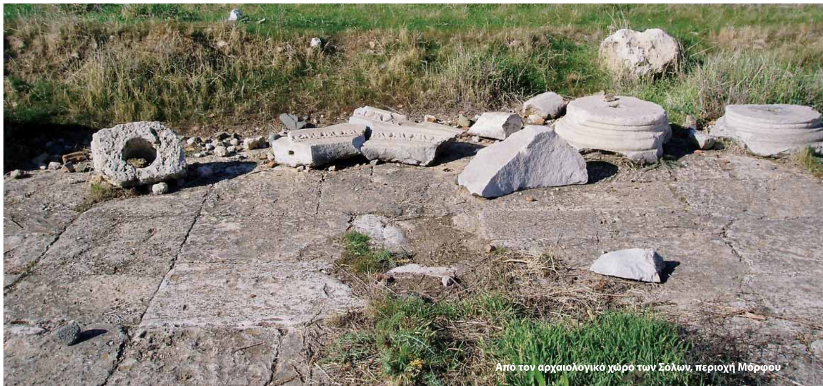
Από τον αρχαιολογικό χώρο των Σόλων, περιοχή Μόρφου

της Τουρκίας κατά της Κύπρου, μεταξύ των οποίων και ο θαρραλέος Τουρκοκύπριος δημοσιογράφος Mehmet Yasin , ο οποίος κατέγραψε την τραγωδία με βαθιά θλίψη σε σειρά άρθρων του στο περιοδικό Olay (1982) προειδοποιώντας ότι «η Κύπρος αποξενώνεται από τον εαυτό της· η ιστορική, περιβαλλοντική, κοινωνική, πολιτιστική της δομή καταστρέφεται...».