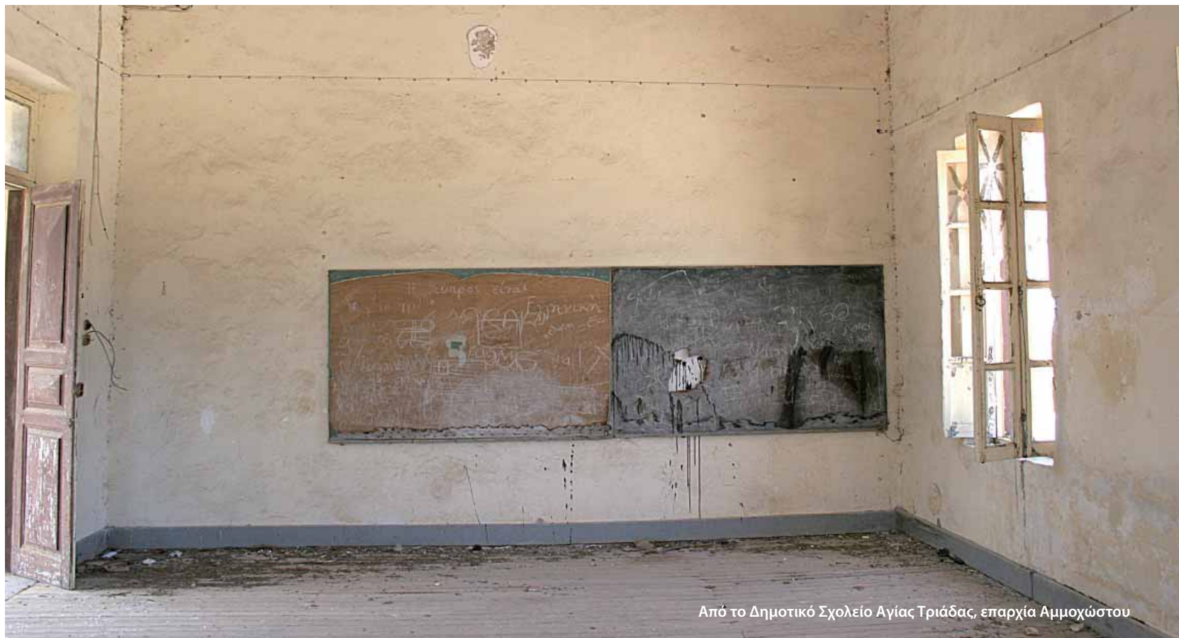
Από το Δημοτικό Σχολείο Αγίας Τριάδας, επαρχία Αμμοχώστου

Η αλλαγή των τοπωνυμίων έγινε κατά παράβαση του διεθνούς δικαίου, ψηφισμάτων του Οργανισμού Ηνωμένων Εθνών για την Κύπρο, και του ψηφίσματος Αρ.16 της 3 ης διεθνούς διάσκεψης του ΟΗΕ για την Τυποποίηση Γεωγραφικών Ονομάτων το 1977. Σήμερα, η ελληνική γλώσσα στην κατεχόμενη περιοχή επιβιώνει μόνο στις ελάχιστες διασωθείσες αρχαίες επιγραφές, στις πινακίδες των δρόμων της περίκλειστης πόλης της Αμμοχώστου, στις σπασμένες ταφόπλακες και σταυρούς των κοιμητηρίων και στο στόμα των ολιγάριθμων Ελληνοκυπρίων εγκλωβισμένων της Κερπασίας.