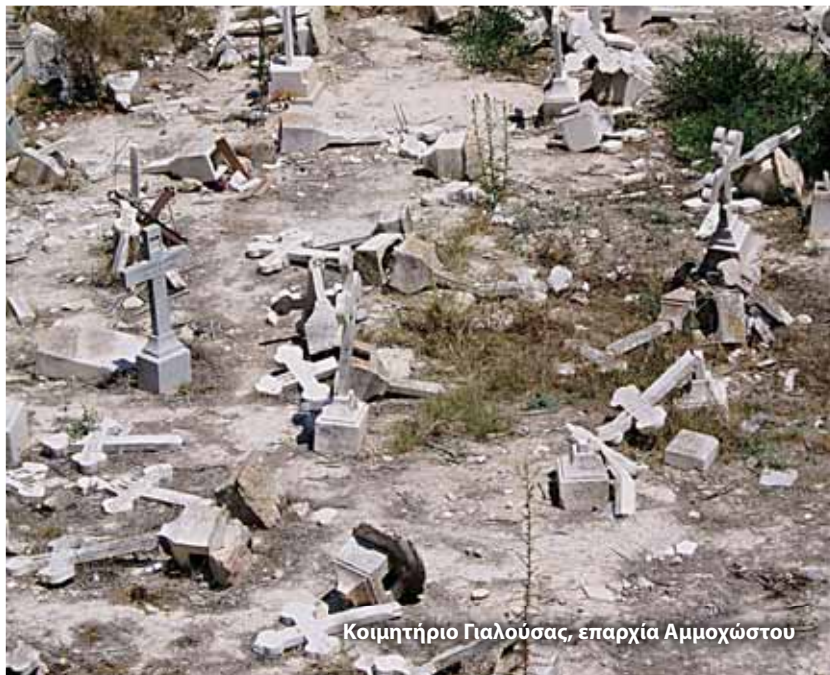
Κοιμητήριο Γαλούσσας, επαρχία Αμμοχώστου

σε μουσουλμανικά τεμένη ή σε μουσεία ή σε κέντρα ψυχαγωγίας ή, ακόμα, σε ξενοδοχεία, όπως η Αγία Αναστασία της Λαπήθου. Τρία τουλάχιστον μοναστήρια μετατράπηκαν σε στρατόπεδα του τουρκικού στρατού (του Αγίου Χρυσοστόμου στον Πενταδάκτυλο, της Αχεροποιήτου στον Καραβά, του Αγίου Παντελεήμονα στη Μύρτου). Και το χειρότερο: Περιφημες βυζαντινές τοιχογραφίες και ψηφιδωτά σπάνιας τέχνης αποτοιχίστηκαν από Τούρκους αρχαιοκάπηλους και πωλήθηκαν παράνομα σε συλλέκτες στην Ευρώπη, την Αμερική, την Ιαπωνία. Επίσης, βυζαντινές εκκλησίες έχουν υποστεί ανεπανόρθωτες ζημιές.