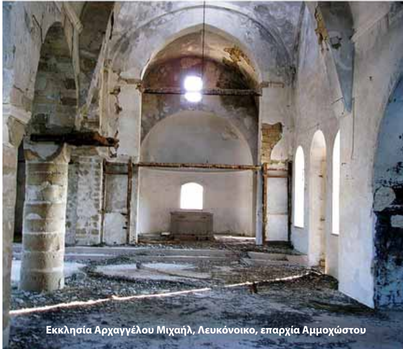
Εκκλησία Αρχαγγέλου Μιχαήλ, Λευκόνοικο, επαρχία Αμμοχώστου