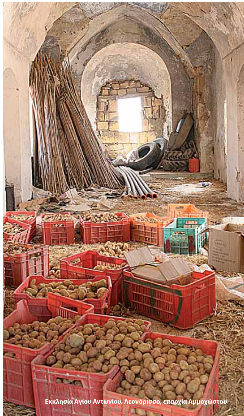
Εκκλησία Αγίου Αντωνίου, Λεονάρισσο, επαρχία Αμμοχώστου

Ο σχεδιασμένος από την Άγκυρα διαχωρισμός ενισχύεται το 1983 με τη «μονομερή ανακήρυξη ανεξαρτησίας» από την τουρκοκυπριακή ηγεσία - με την ενθάρρυνση και υποστήριξη της Τουρκίας - στο κατεχόμενο τμήμα της Κυπριακής Δημοκρατίας, και με την εγκαθίδρυση της ούτω καλούμενης «Τουρκικής Δημοκρατίας της Βόρειας Κύπρου». Η διεθνής κοινότητα καταδίκασε την αποσχιστική αυτή ενέργεια άμεσα και κατηγορηματικά, ενώ το ίδιο το Συμβούλιο Ασφαλείας των Ηνωμένων Εθνών διακήρυξε ότι η πράξη αυτή ήταν «νομικά άκυρη» και απαίτησε την ανάκληση της «μονομερούς ανακήρυξης ανεξαρτησίας». Ως εκ τούτου, το παράνομο κατοχικό καθεστώς δεν έχει αναγνωριστεί από κανένα άλλο κράτος παρά μόνο από την Τουρκία, την κατοχική δύναμη.