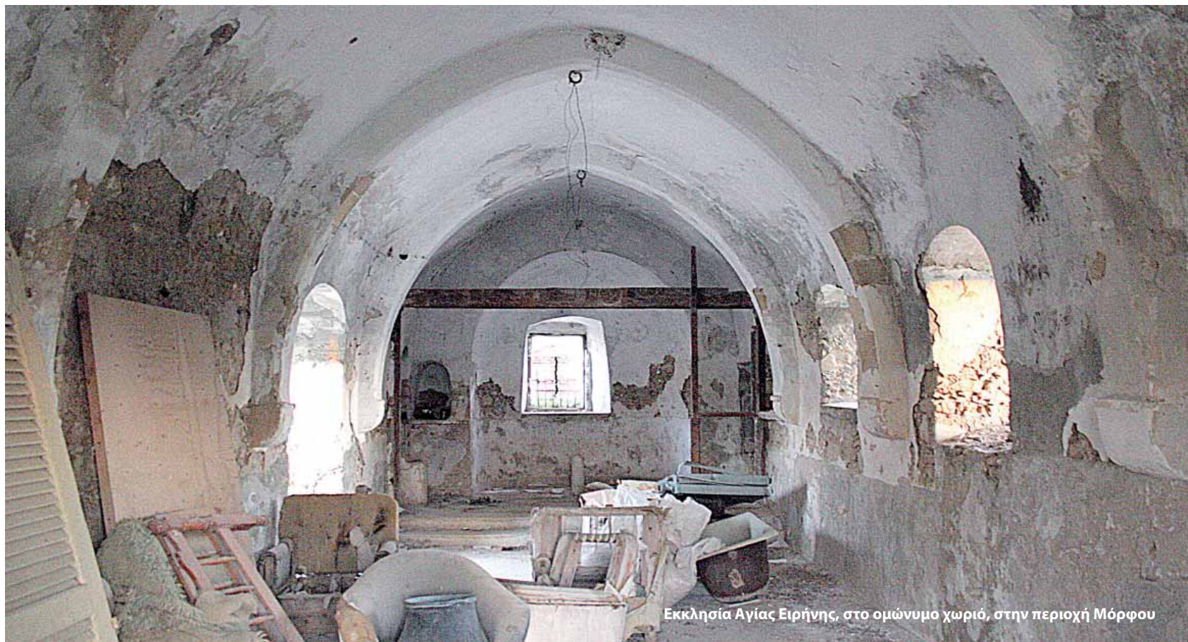
Εκκλησία Αγίας Ειρήνης, στο ομώνυμο χωριό, στην περιοχή Μόρφου

Από το 1974 η Τουρκία διαπράττει εναντίον της Κύπρου ένα τεράστιο διπλό διεθνές έγκλημα. Έχει εισβάλει και διαιρέσει ένα μικρό, αδύναμο, αλλά σύγχρονο, ανεξάρτητο και ευρωπαϊκό κράτος - από την 1 Μαΐου 2004 και επίσημα μέλος της Ευρωπαϊκής Ένωσης. Ταυτόχρονα, από τότε αλλάζει το δημογραφικό χαρακτήρα του νησιού και επιδίδεται σε συστηματική καταστροφή και εξαφάνιση της πολιτιστικής κληρονομιάς του στις περιοχές που έθεσε υπό την κατοχή της.