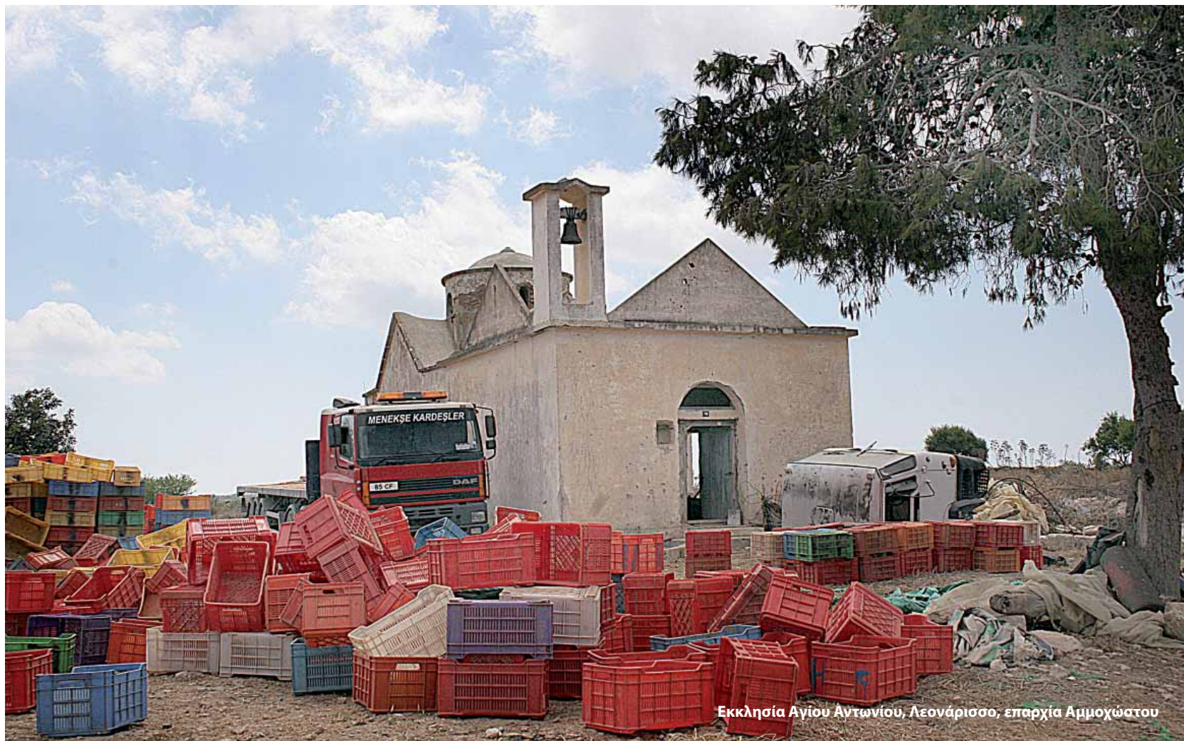
Εκκλησία Αγίου Αντωνίου, Λεονάρισσο, επαρχία Αμμοχώστου

Στη μακράιωνη ιστορία της, η Κύπρος βρέθηκε αντιμέτωπη με πολλές επιδρομές, λεηλασίες και κατακτήσεις από πανίσχυρες κατά καιρούς αυτοκρατορίες. Ο φυσικός της πλούτος και η στρατηγική της θέση καθόρισαν ουσιαστικά την πολυτάραχη ιστορική διαδρομή της. Από τον 11 ο π.Χ. αιώνα, οπότε διαμορφώνεται ο κατ' εξοχήν ελληνικός της χαρακτήρας, έζησε κατά περιόδους ελεύθερη και το μεγαλύτερο διάστημα κάτω από την εξουσία Ασσυρίων, Αιγυπτίων, Περσών, Ρωμαίων, Φράγκων, Ενετών, Οθωμανών και Άγγλων.