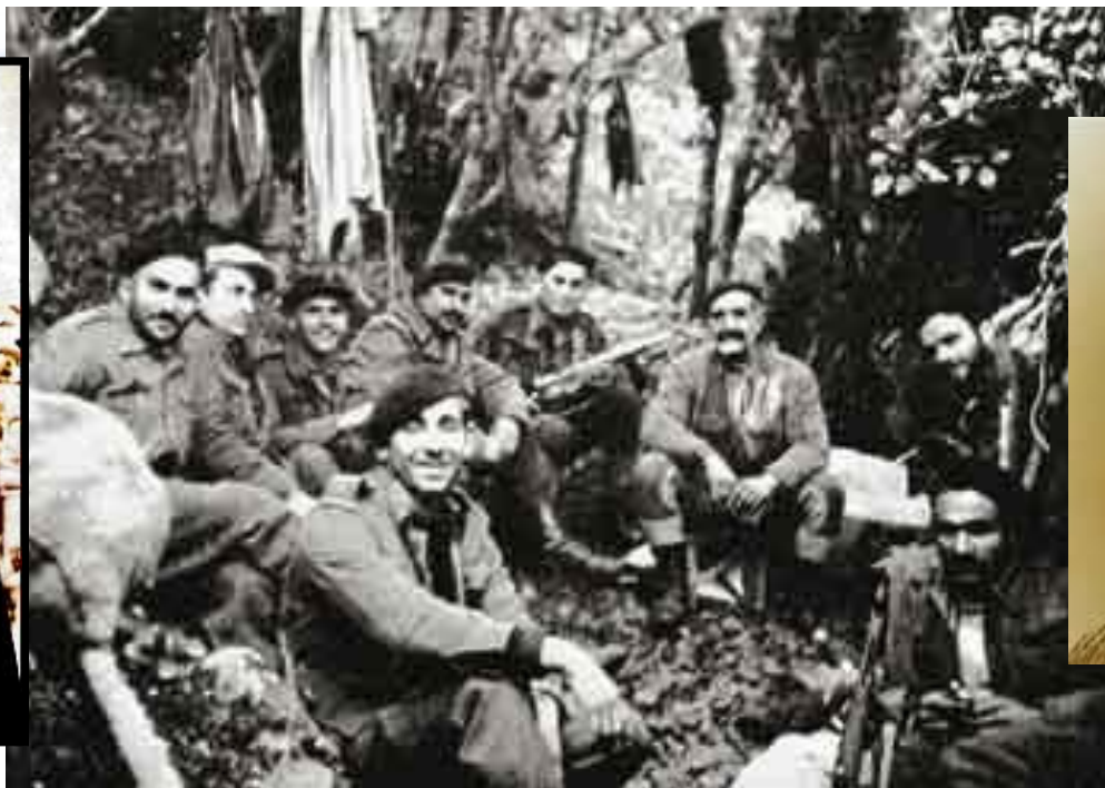
Γεώργιος Γρίβας Διγενής