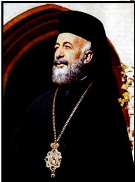
Αρχ. Μακάριος Γ΄